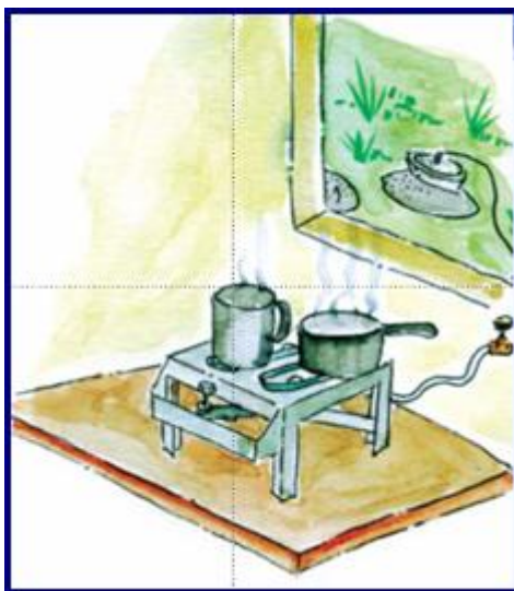
Figura 6 – Desenho esquemático da utilização do biogás

A Lei Federal de Águas, Lei 9433/97, assim como a Lei Estadual do Rio de Janeiro 3239/99, estabelece que os valores arrecadados com a cobrança do uso da água deverão ser aplicados na região ou na bacia hidrográfica em que foram gerados. Segundo o Art. 27, Inciso III, da Lei 3239/99, a cobrança pelo uso de recursos hídricos objetiva: “obtenção de recursos para financiamento dos programas e intervenções contemplados nos Planos de Bacia Hidrográfica (PBH's)”. Por sua vez, os Planos de Bacia devem ser aprovados pelos respectivos comitês.