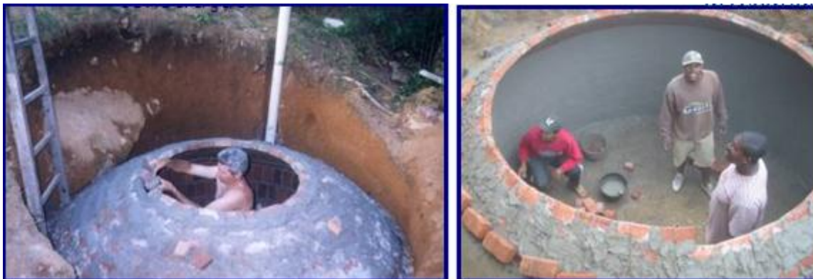
Figura 4 – Envolvimento da comunidade na construção

As obras do biodigestor contaram com a participação direta da mão de obra da comunidade (Figura 4). Dessa forma novos postos de trabalho foram criados e a comunidade foi diretamente envolvida em todas as etapas do desenvolvimento do projeto. Durante a execução das obras do biodigestor a comunidade também foi convidada a participar de aulas e “workshops” de educação ambiental (Figura 5).