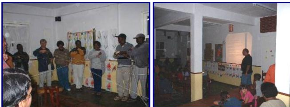
Figura 5 – Trabalho de educação ambiental

No projeto da comunidade Independência o biogás gerado no biodigestor foi cedido à uma creche local, onde o botijão de gás natural foi substituído parcialmente pelo biogás (Figura 6). Esta mudança trouxe economia e benfeitoras para a creche, uma vez que o dinheiro utilizado na compra de botijão de gás natural foi revertido em reforço nos lanches das crianças.