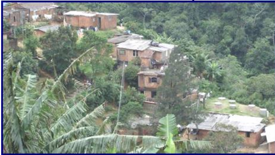
Figura 2 – Implantação do sistema

Esta última é a responsável pela produção do biogás, mistura de metano e carbono que pode ser usada como fonte de calor, combustível, energia. O bio-sólido resultante desses processos de fermentação é de alto valor nutricional para as plantas e o líquido gerado no efluente pode ser utilizado para fertirrigação e cultivo em geral.