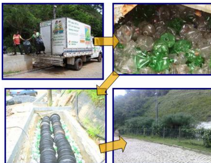
Figura 7 – Utilização de PET e PNEUS reciclados

Outro tópico inovador na concepção dos biossistemas merece destaque. Os filtros biológicos são tradicionalmente projetados com leito filtrante composto de brita, seguindo as recomendações técnicas da ABNT. Após a implantação dos biodigestores pela Águas do Imperador, existem agora filtros biológicos. Foi desenvolvido uma tecnologia de compressão de garrafas PET através de calor, fazendo com que as mesmas se assemelhem, após o tratamento, às pedras britadas. Logo, estas são utilizadas como leito filtrante no lugar da tradicional pedra britada. Com o advento da educação ambiental, a coleta e o tratamento das garrafas PET pela própria comunidade, propiciou-se um engajamento dos moradores na limpeza dos córregos, removendo com eficiência as garrafas PET da comunidade. Hoje existe no município, implantado pela própria prefeitura, um programa remunerado, similar ao dos catadores de latas de alumínio, para garrafas PET. Todos projetos contam com PET reciclado e tratado para composição do sistema. filtração e zona de raízes (Figura 7).